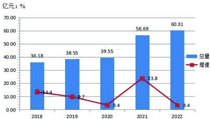
图 1 2018-2022 年全部工业增加值及其增长速度

全年建筑业增加值 12.19 亿元，比上年增长 10.6%，占 GDP 的比重为 7.1%。